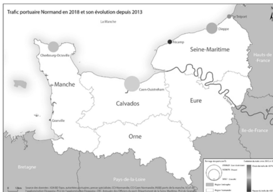
Figure 1 : Evolution du trafic portuaire normand de 2013 à 2018

Réalisation/conception : Jules Garraud & Ronan Kerbiriou