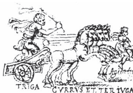
Fig. 13. Stresa, archivio Borromeo