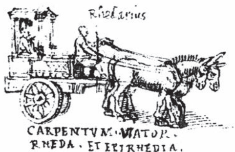
Fig. 12. Stresa, archivio Borromeo