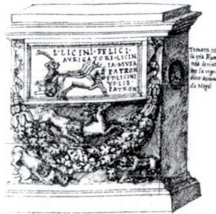
Fig. 11. Napoli, B.N., XIII.B.8, f.92