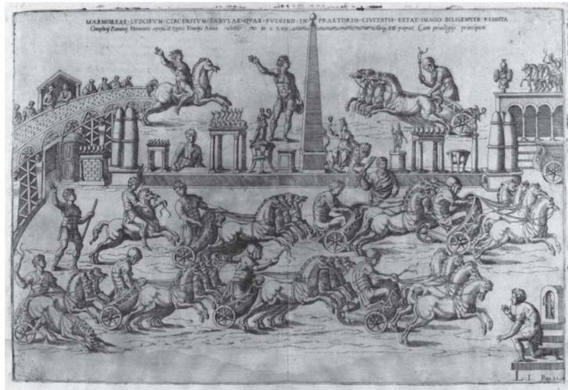
Fig. 14 O. PANVINIUS, De ludis circensibus , p. 11

exposé Claudio Tolomei, fondateur de l' Accademia della Virtù , dans sa lettre envoyée à Agostino Landi en 1542 29 ; c'est finalement Ligorio qui recueillit cet héritage et réalisa ce projet, en rédigeant, avec l'aide des autres membres de l' Accademia degli Sdegnati , ses livres sur les Antichità romane 30 . Le projet de Tolomei mentionnait explicitement la présence d'un livre sur les cirques : [...] i tempii, i portichi, i teatri e gli anfiteatri, le cune, le basiliche, gli archi, le terme, i circhi, i ponti, e ogni altro edifizio di che rimanga vestigio alcuno [...] 31 que Ligorio avait déjà mené à terme au moment où il écrit son traité sur les véhicules anciens ( secondo havemo detto nel libro di giuochi ) et que Panvinio exploitera, dans une mesure sans doute plus importante qu'on ne l'imagine, pour rédiger et illustrer ses livres De ludis circensibus .