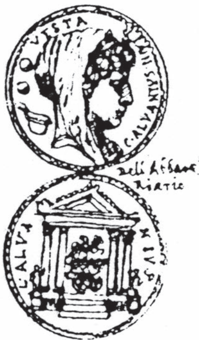
Fig. 1. Torino, Archivio di Stato, Ja.II.6, f.89r.

jectif plautus et désigne donc un véhicule large et plat sans aucune structure ni siège ( Nobis plaustrum dici a plauto videtur, quia vehiculum fuit latum, id est non in ambitum structum tabulis, aut cum sella superne, verum planum : « Il me semble que le plaustrum vient de plautus , parce que ce type de véhicule était large, c'est-à-dire sans structure de bois, ni siège dessus mais tout à fait plat 9 . »)