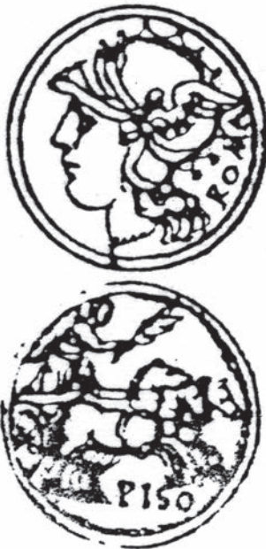
Fig. 9, Torino, Archivio di Stato, Ja.II.6, f.92r.

Quant aux chars de courses représentés sur une autre gravure du livre De ludis circensibus (fig. 14), ils apparaissent à plusieurs reprises dans les Antichità romane et notamment dans le paragraphe consacré aux chars à trois chevaux ( DELLA TRIGA CARRO ), accompagné cette fois d'un dessin d'une monnaie (fig. 9) : Triga ancora era il medesimo carro, ch'era la biga, detta a triuga, cioè tirata con la congiunzione di tre cavalli al giuogo, come la nominano le antiche memorie scritte in marmo degli agitatori delle fattioni circensi, secondo havemo detto nel libro di giuochi. La qual triga si vede anco nel danaro in questo modo, pure con la vittoria et con altri, che la guidano, come potete veder tra gli altri danari mostrati in quest'opera.