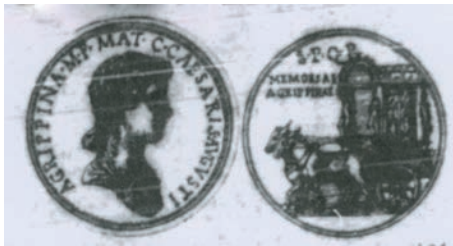
Fig. 3. Torino, archivio di stato, Ja.II.8, f. 127r.

Scheffer omet cependant de dire que Ligorio cite une source numismatique très précieuse pour connaître la forme du carpentum ; il s'agit de la médaille frappée par Caligula à l'effigie de sa mère Agrippine décédée, où apparaît son char tiré par deux mulets (fig. 3) et que Scheffer lui-même utilisera dans son chapitre consacré à ce véhicule ; contrairement à son habitude, Ligorio ne reproduit pas le dessin de la médaille dans la marge de son chapitre ; la raison est sans doute que le dessin de la médaille se trouvait déjà ailleurs dans ses Antichità romane , et plus précisément dans le chapitre consacré aux monnaies d'Agrippine, où la comparaison avec le sesterce original (fig. 4) révèle tout le talent de dessinateur de Ligorio.