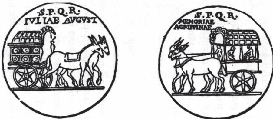
Fig. 5. Carpentum , in J. Scheffer, De re vehiculari , p. 115

Comme on l'a dit, Scheffer, reproduira à son tour la monnaie d'Agrippine ainsi que celle de Julie (fig. 5), dans le chapitre consacré au carpentum au livre II de son De re vehiculari (II, XVI) ; il s'agit de monnaies qu'il a vues chez Magnus Gabriel de la Gardie (1622-1686), grand chancelier de Suède et favori de la Reine Christine (p. 115 : ex nummo illustriss(imi) Comitis Magni de la Gardie, Regni cancellarij ) :