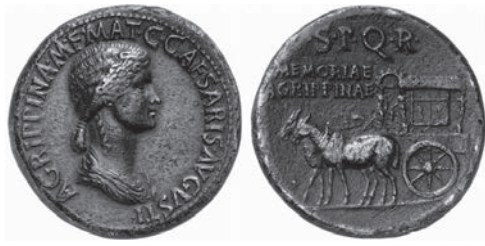
Fig. 4. Sesterce à l'effigie d'Agrippine

Comme on l'a dit, Scheffer, reproduira à son tour la monnaie d'Agrippine ainsi que celle de Julie (fig. 5), dans le chapitre consacré au carpentum au livre II de son De re vehiculari (II, XVI) ; il s'agit de monnaies qu'il a vues chez Magnus Gabriel de la Gardie (1622-1686), grand chancelier de Suède et favori de la Reine Christine (p. 115 : ex nummo illustriss(imi) Comitis Magni de la Gardie, Regni cancellarij ) :