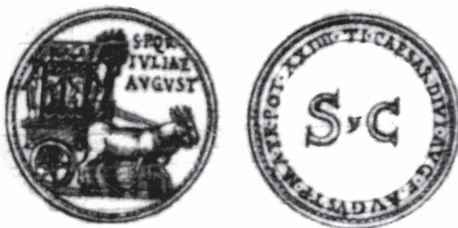
Fig. 6. Torino, archivio di stato, Ja.II.8, f.125r.

Pour sa part, Ligorio appellera thensa le véhicule figurant sur la monnaie de Julie, qu'il reproduit dans le chapitre consacré aux monnaies de Tibère (fig. 6), tout en reconnaissant, dans le chapitre de son traité consacré à ce véhicule, qu'il était parfois confondu avec le carpentum 19 : Non è da dubitar punto in questi rovesci di questa medaglia fatta nel vintesimo quarto anno dell'imperio di Tiberio, che questi carri che vi sono non siano il carro chiamato TEMPSA, il quale s'usava menar nelli ludi circensi dopo la morte dell'imperadori, quando erano chiamati divi, il cui honore consegui Iulia figliola di Augusto chef u moglie di Tiberio et consenso del senato e popolo romano.