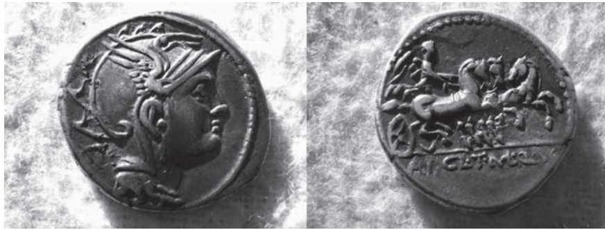
Fig. 10 denier d' Appius Claudius Pulcher (110-111 av. J.-C.)

denier de L. Calpurnius Piso dont l'avvers montre un cavalier au galop, tenant une palme dans la main 24 , il semble plus probable de voir dans le dessin ligorien une représentation plus ou moins correcte du denier romain républicain d' Appius Claudius Pulcher , émis en 111/110 av. J.-C., qui illustre à la fois un trige et une tête de Rome (fig. 10) 25 . Quant aux memorie scritte auxquelles Ligorio fait allusion, il s'agit de monuments qu'il a reproduits dans ses Antichità romane , soit sur la base de témoignages authentiques comme celui de Cléobis et Biton, soit en les « inventant » de toutes pièces comme le monument à L. Licinus Felix (fig. 11 : CIL VI 2218*).