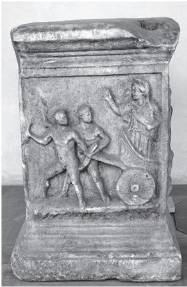
Fig. 7. Rome, Musée des thermes de Dioclétien

de Cléobis et Biton, que Ligorio rapporte dans la version de Plutarque 20 : [...] negli antichi monumenti veggiamo sculpito sifatto carro, con che le donne andavano colle placente a sacrificare a Cerere, colla cesta piena di spiche et di foccacie. Et alcuna fiata hanno due ruote, altri con quatro ruote. Si vede anchora sifatto carro nella casa del Mafei in Roma nell'antica historia di Cleobi e di Bitone argivi, i quali giovanetti invece di buoi tirarono il carro, che alcuni dicono plaustro, altri amaxa, altri vehiculo, altri pilento secondo gli accomoda nel verso la parola, non curando di osserrar l'uso del tempo et delle lingue, bastando lor dire un carro dato alla comodità di tali effetti nei sacri misteri usato ; col quale andò colle accese facelle la madre di detti giovanetti al tempio di Junone ; la quale non potendo havere i buoi attempo, i figlioli tirarono il carro. Et essendo stati gli atti di quelli pietosi et di religiosa gloria, essa sacerdotessa poi pregò la dea per la felicità di quelli ; et tosto amendue s'adormirono nel tempio, né mai più si svegliarono ; dal che fu compreso che è meglio la morte nel fine glorioso che vivere con pene e doglie, et con pericolo sotto speranza di questa humana vita. Così scrive Plutarco nella consolazione della morte.