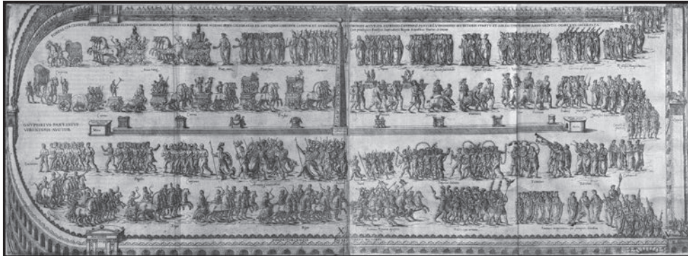
Fig. 8. O. Panviniis, De ludis circensibus , p. 89