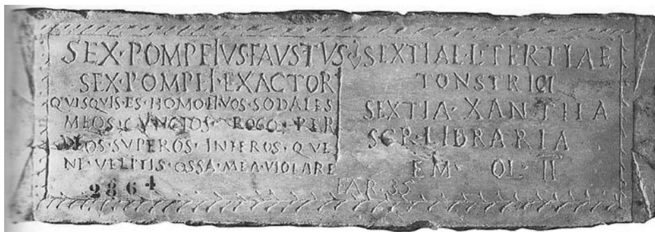
Figura1. ILMN 6322