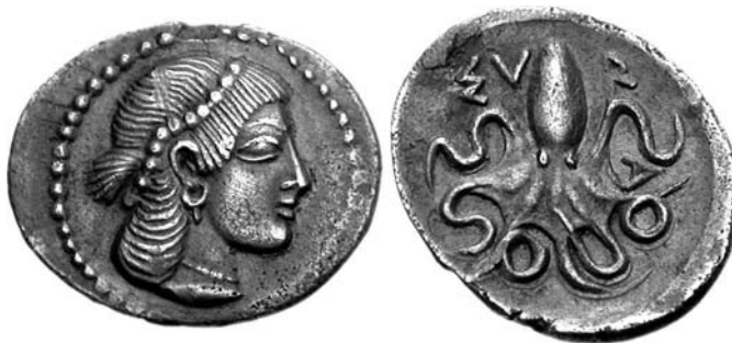
Figura 3. Moneta di Syracusa. SNG,Copenhagen 383

E' difficile sapere se Ligorio, per questo ritratto di Saffo, si ispirò dalla moneta di Siracusa con la testa di Arethusa e con un polipo sul rovescio o pure di quella di Metilene con un ritratto femminile e con una lira sul rovescio; in ogni caso, l'iconografia ligoriana ebbe fortuna, attraverso l'edizione di Orsini prima e poi di quella del Bellori (Bellori 1685) e la collezione numismatica di Farnese contava una medaglia con la stessa iconografia (Faber 1606, tav.129); non si sa se fosse conziata da Ligorio ma si sa