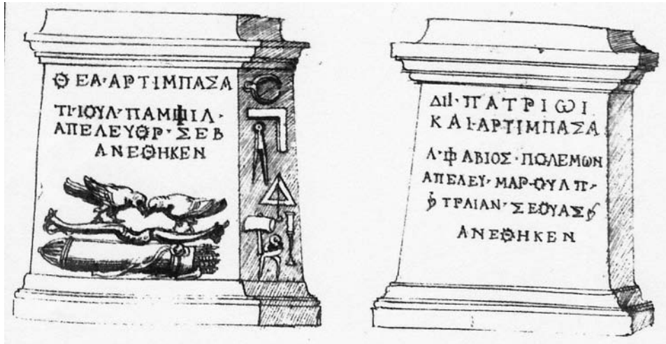
Figura 6. Napoli, BN, XIII.B.7, fol. 419r.

che qualche volta scrive sua interpretazione per vincer qualche contentione, come fu quella delli fasti di Verrio Flacco».